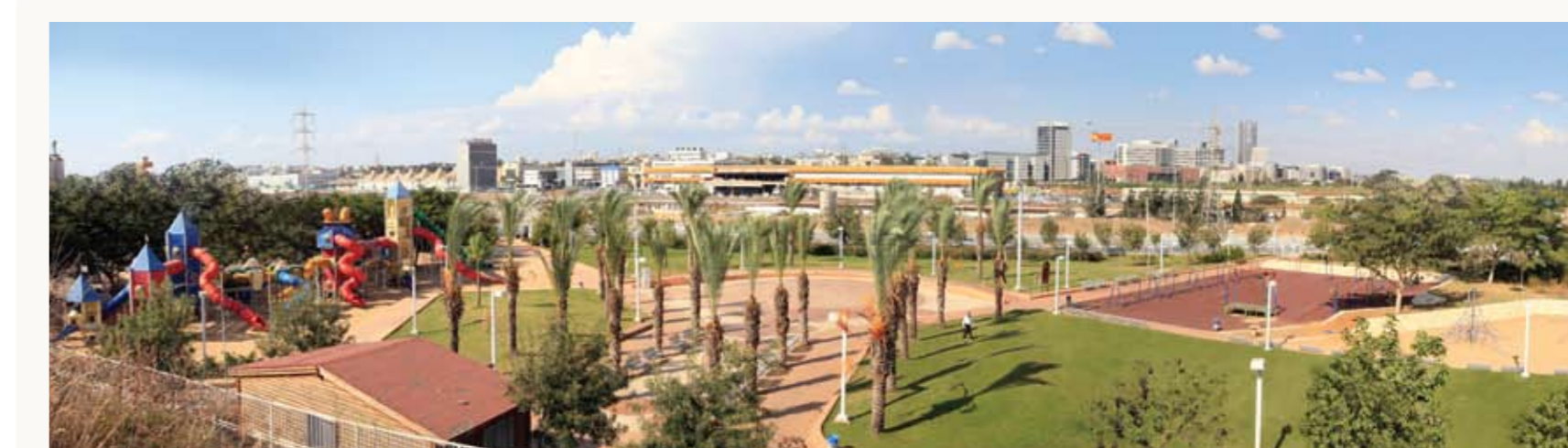
פארק גני הזית

חברת אדירים מזמינה אתכם לעלות לשיא חדש באיכות החיים של מגורי יוקרה, בפרויקט "גני הזית" בפרויקט מתחם מגורים אקסקלוסיבי במיקום הטוב ביותר בגני-ברק, מול נוף ירוק עוצר נשימה. מיקומו הנדיר של הפרויקט על פארק גני הזית מבטיח לכם מרחבים ירוקים בשטח כולל של כ-20 דונם, מאובטחים ומגודרים. הפארק שופע מדשאות, עצים, מתקני משחקים, שבילי אופניים והליכה וכל זאת מתחת לבית החדש שלכם בסביבה מושלמת לילדים ולמשפחות.